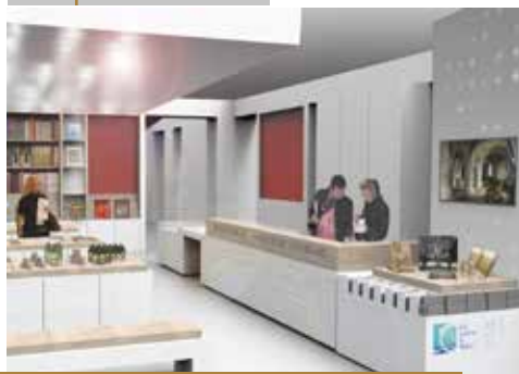
Rez-de-chaussée, accueil et boutique

Actuellement situé rue Orléanaise, l'Office de Tourisme sera transféré au sein de ce nouvel équipement où l'accueil et la boutique seront mutualisés avec le Centre, ouvrant les visiteurs aux autres richesses du territoire.