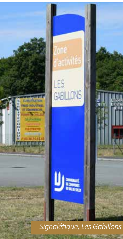
Signalétique, Les Gabillons