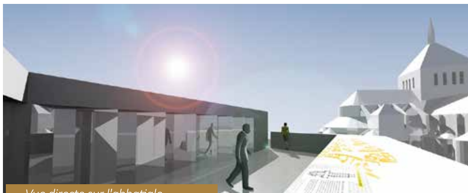
Vue directe sur l'abbatale.