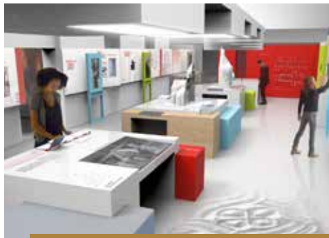
1 er étage, l'exposition permanente