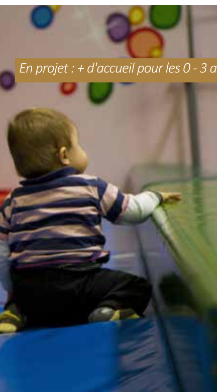
En projet : + d'accueil pour les 0 - 3 ans

En projet : installation de panneaux lumineux sur tout le territoire.